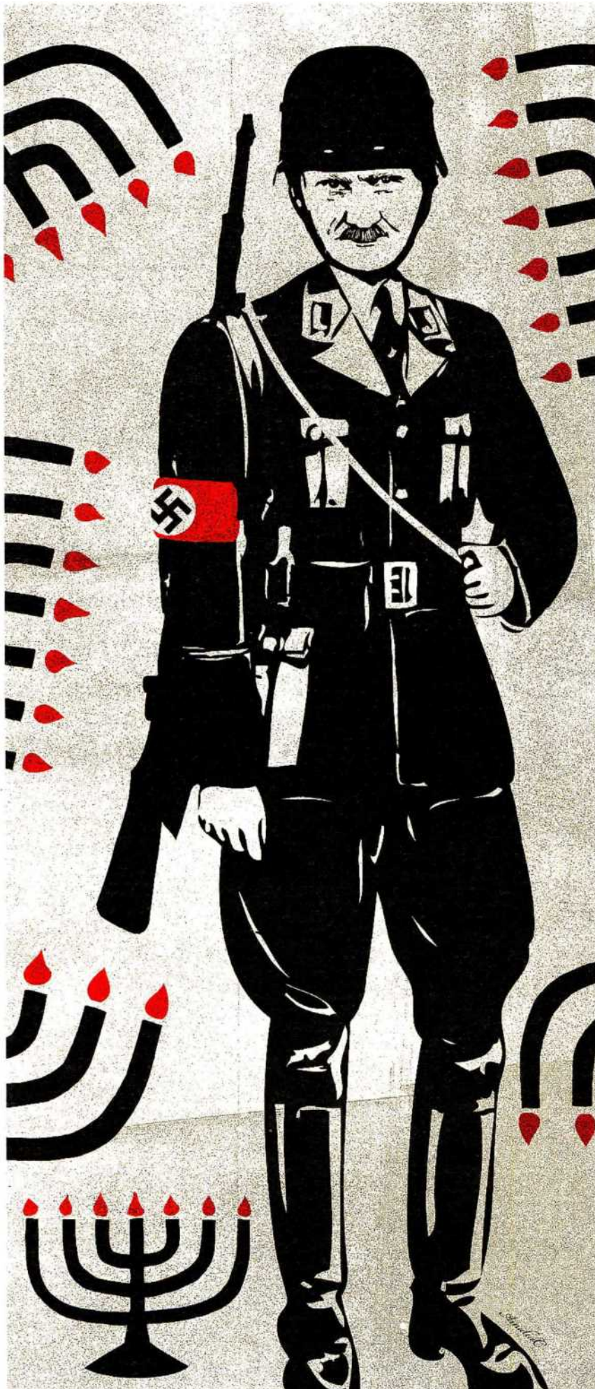
ILLUSTRAZIONE DI AMALIA CARATTOZZOLO